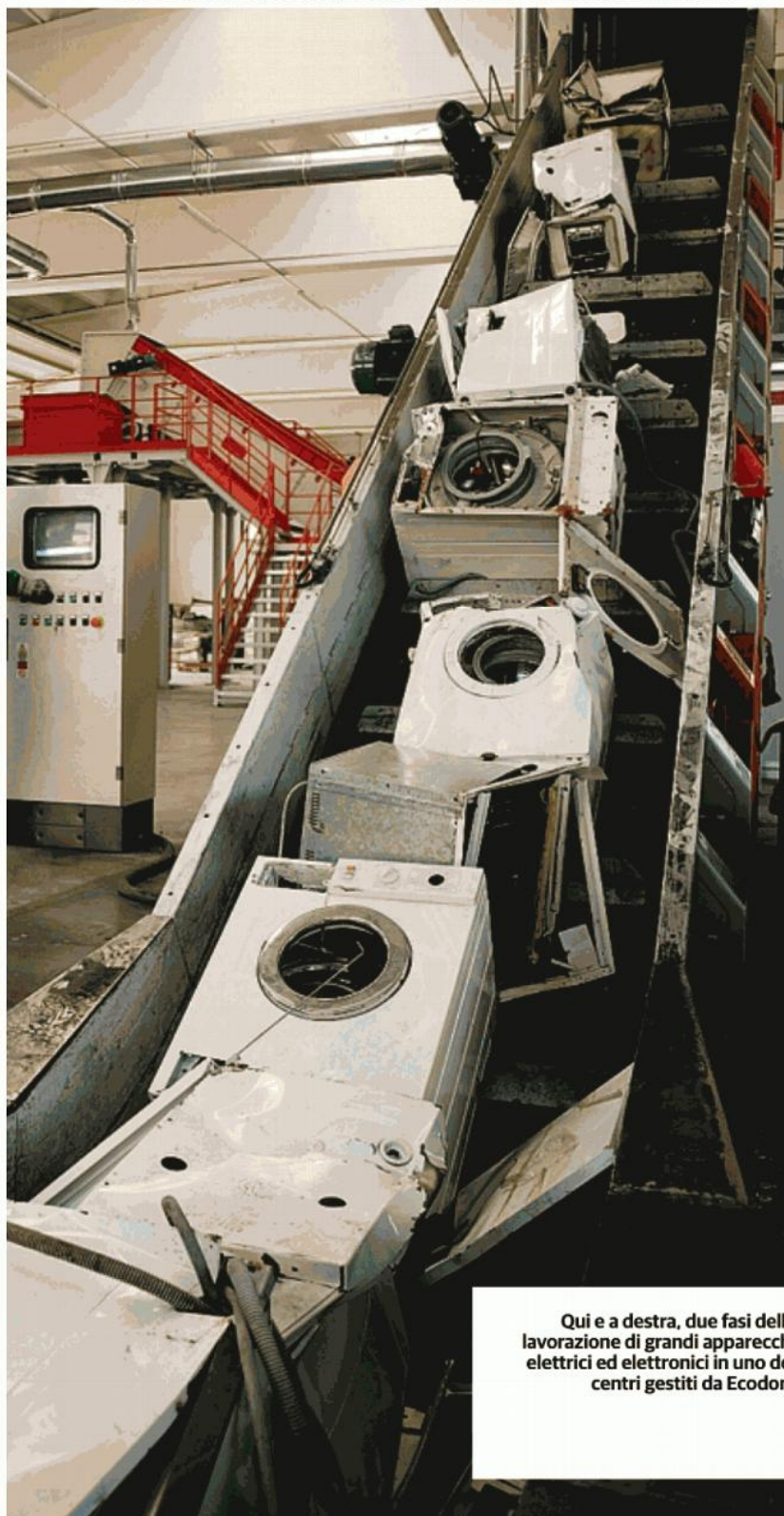
Qui e a destra, due fasi della lavorazione di grandi apparecchi elettrici ed elettronici in uno dei centri gestiti da Ecodom

Percentuale dei materiali recuperati dagli apparecchi elettrici ed elettronici raccolti e trattati dai consorzi di smaltimento