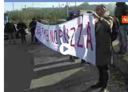
Tmb Salario, paura a Roma dopo l'incendio: il fumo continua a uscire dagli impianti