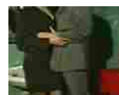
Sesso nei bagni della Camera, spunta un video. Il leghista: "Qui dentro...", roba scabrosa