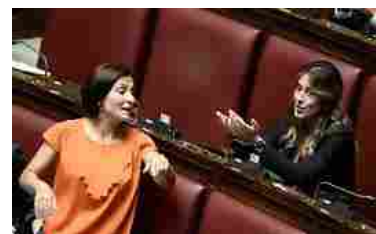
"S*** nei bagni della Camera? Chiedete alla Morani". Terremoto a luci rosse a Montecitorio