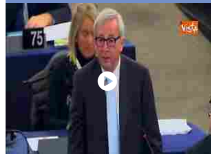
Brexit, Jean Claude Juncker: "Sono sorpreso perché con Theresa May ci eravamo messi d'accordo"