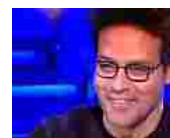
Domenica In, la pazzesca cafonata di Gabriel Garko: dove piazza le scarpe, scatta il massacro in diretta