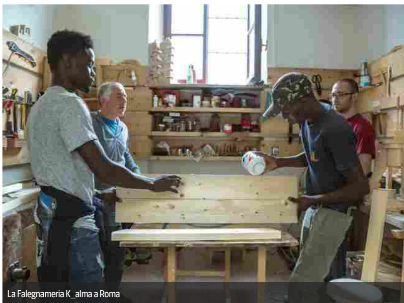
La Falegnameria K_Alma a Roma

Legno di scarto trasformato in mobili d'arredamento da migranti richiedenti asilo della falegnameria sociale K_Alma, il progetto The Circle, che utilizza acqua di allevamento delle carpe purificata per irrigare vegetali, l'eco-villaggio realizzato in bioedilizia dall'associazione no profit Panta-Rei, l'attività di recupero contro lo spreco alimentare dell'associazione Recup.