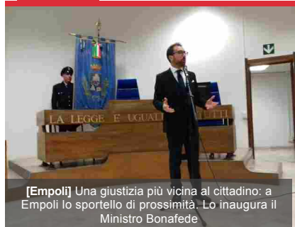
[Empoli] Una giustizia più vicina al cittadino: a Empoli lo sportello di prossimità. Lo inaugura il Ministro Bonafede