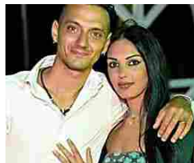
Muore due giorni dopo lo schianto