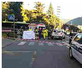
Incidente mortale in piazza Vittoria