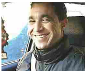
Appello della madre: «Non ce la faccio più»